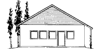
Schleppdach an Traufe ca. 1,00 m